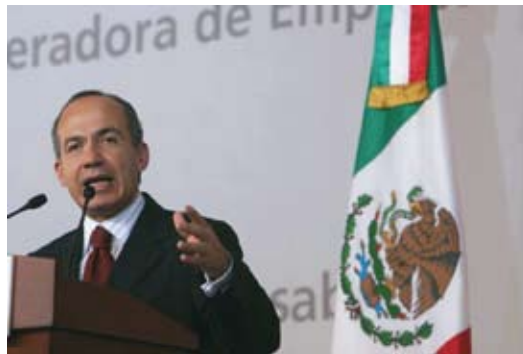
El presidente, Felipe Calderón, está dispuesto a terminar con la lacra del juego ilegal en México

Otra de las situaciones que se están contemplando a corto plazo es conseguir que los operadores legalmente constituidos obtengan cierta "permisividad" y puedan instalar en sus locales las denominadas máquinas de azar de la "Clase III", (la comúnmente conocida como máquina de Casino). Hoy día las máquinas "Clase III" están funcionando en locales sin licencia o de dudoso permiso en lo que es una franca competencia desleal que, además no reporta al estado ni un solo beneficio a través de impuestos perdidos por imposible cobro. Todo parece apuntar a que la SEGOB es consciente de esta situación y que bien podría atender las peticiones de los permisionarios de juego.