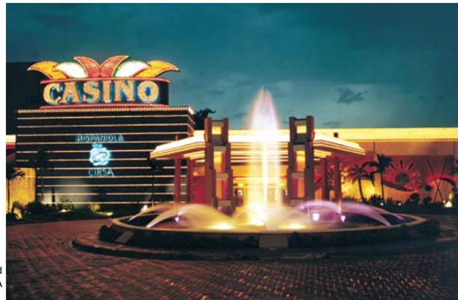
Casino Hispaniola, propiedad de la Corporación CIRSA

braremos en Dominicana puede ser catalogado como un certamen de riesgo por alguien que no conozca a fondo cómo estamos desarrollando nuestro trabajo; pero este riesgo se minimiza cuando disponemos de los ingredientes (experiencia, respaldo, confianza, solidez y profesionalismo) necesarios para que la feria sea un éxito. Además contamos con el apoyo de la Secretaría de Estado de Hacienda, de la Comisión de Casinos y de la Asociación Dominicana de Casinos.