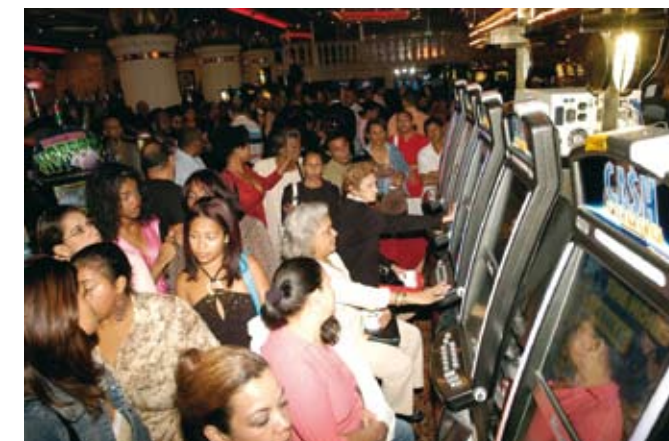
Las tragamonedas es uno de los juegos favoritos de los dominicanos, preferiblemente entre la población femenina