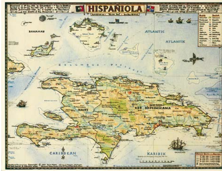
La República Dominicana comparte la isla de la Hispaniola con Haití

El Caribbean Gaming Show & Conference (CGS) que cele-