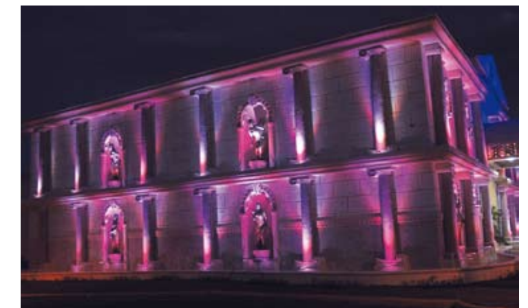
Casino Grand Oasis Marien, enclavado en la zona turística de Puerto Plata