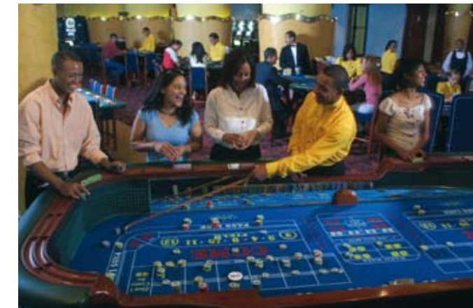
Los juegos de mesas tienen grandes adeptos