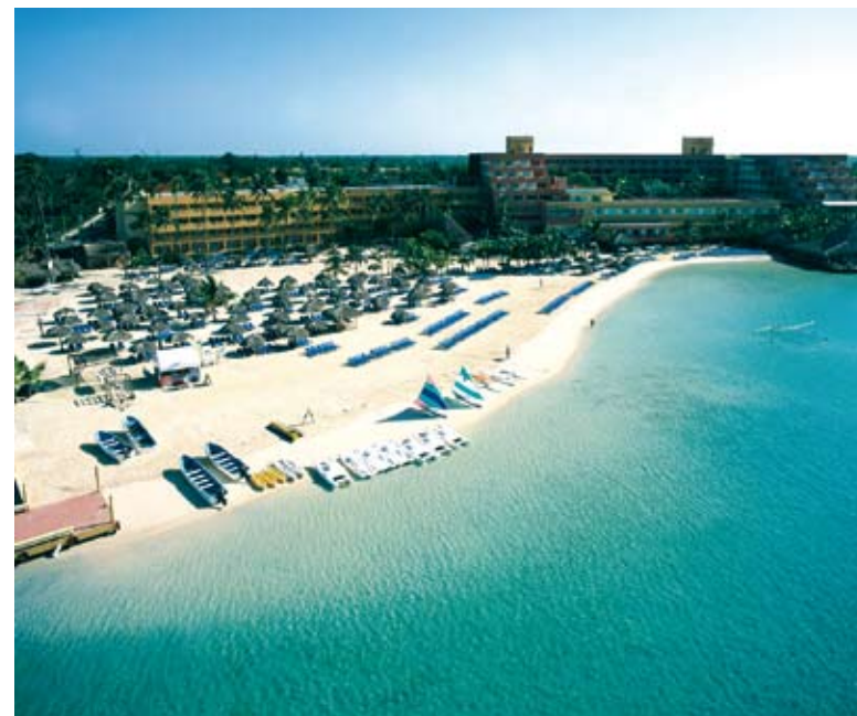
El país es uno de los destinos turísticos preferidos por americanos y europeos